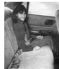
CINTURON DE CADERA Y HOMBROS Posición correcta del cinturón

Por lo general, los niños mayor de 4'9" de altura pueden utilizar cinturones de cadera y hombro.