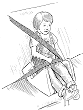
ASIENTO ALTO Posición correcta del cinturón

Los niños que pesan mas de 40 y menos de 4'9" (por lo general de 4 a 8 años de edad) deben de usar un asiento alto.