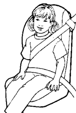
ASIENTO ALTO con respaldo alto Posición correcta del cinturón